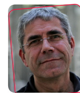
Table ronde avec la participation de membres du comité d'éthique et de l'équipe de soins palliatifs, de personnalités qualifiées, d'associations, de représentants des usagers, d'un anthropologue et de professionnels de santé, présidente des psychologues de la SFAP