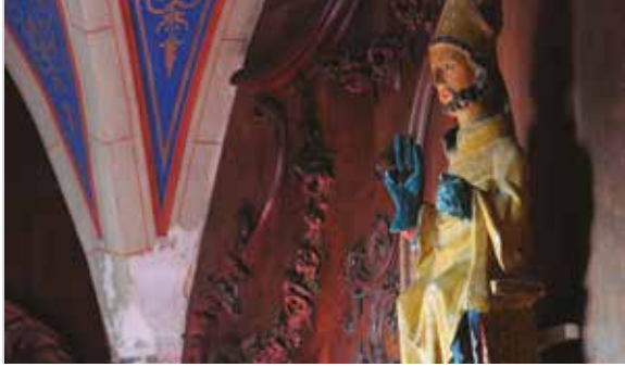
Église Saint-Maurice d'Usson