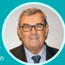
Le Président Jean-Paul Bacquet

« Il s'agit d'un programme incitant à l'amélioration et la réhabilitation de logements en milieu rural ou urbain. C'est donc un dispositif territorialisé destiné à l'amélioration de l'habitat privé ».