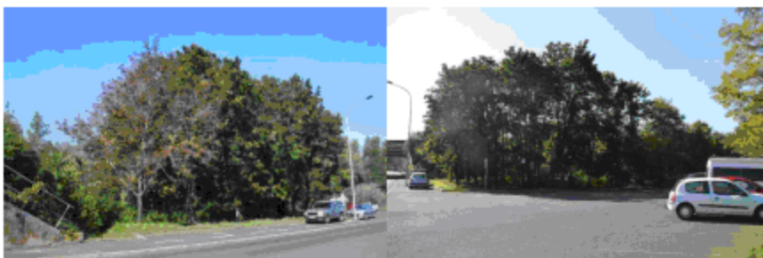
Projet de secteur d'aménagement le long de la rue du 1ers Mars 1962 et au bas de l'autoroute