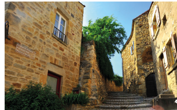
4. Montée des Tisserands