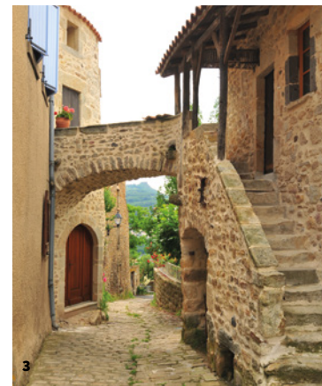
3. Maison vigneronne, rue des Pradets