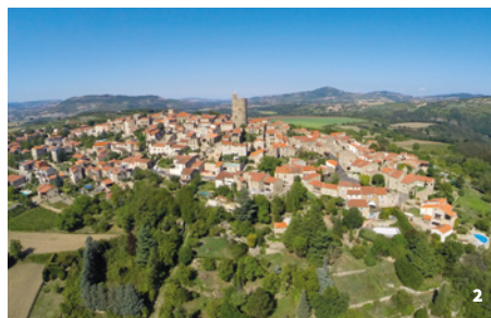
2. Vue aérienne