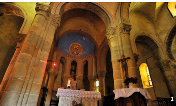
2. Tour maîtresse du 13 e siècle