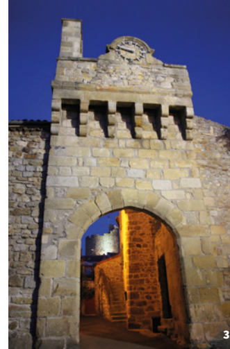
3. Porte fortifiée (fin 14 e - début 15 e siècle)

Montpeyroux est un bourg médiéval organisé selon un plan radioconcentrique, autour du donjon élevé au point le plus haut. Le village était enfermé dans une vaste enceinte flanquée de tours, dont le tracé ovoïde s'observe au nord et à l'est. Elle s'ouvre par une porte fortifiée du 15 e siècle. Malgré l'abandon puis la reconstruction du quartier ancien, on repère des éléments d'architecture de la fin du Moyen-Âge : linteaux en accolade, baies à croisée.