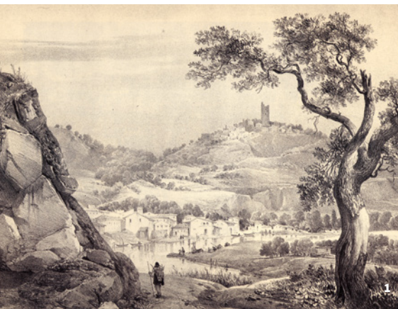
1. Les gorges de l'Allier, Coudes et Montpeyroux, gravure ancienne