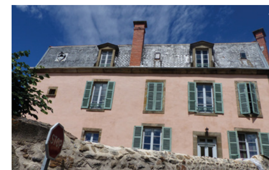
4. Maison vigneronne de la fin du 19 e siècle, rue des Perreux

la pierre de fondation posée par le baron Girod de Langlade, alors député, le 1 er juillet 1846 (pierre d'appui du chaînage d'angle à gauche du portail). Le 1 er niveau d'un clocher octogonal est édifié en 1847.