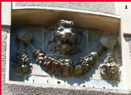
1. Maison la Kasbah. Détail du décor, cour intérieure