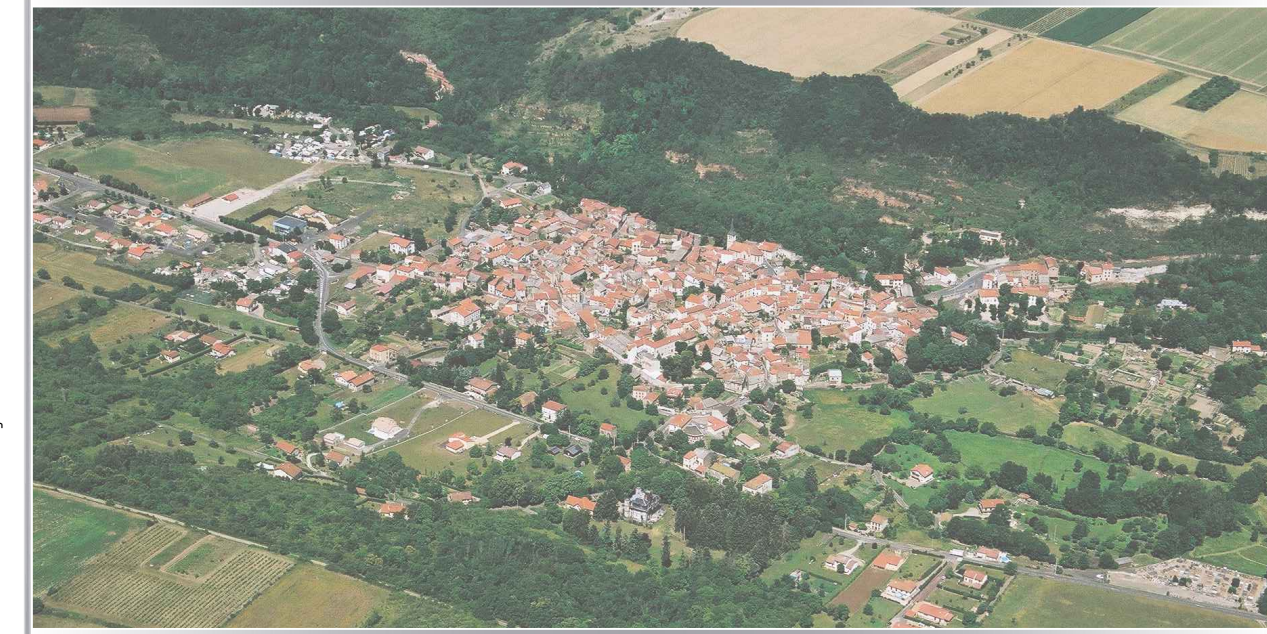
Planche Globale et Centre Bourg - Echelle : 1/5000 et 1/2500

Plan local d'urbanisme : Elaboration du Plan Local d'Urbanisme : 23/02/2015 Arrêt du Plan local d'urbanisme par délibération du Conseil Communautaire : 23/02/2023 Vu pour être annexé à la délibération du Conseil Communautaire : 23/02/2023