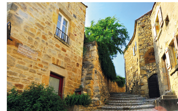
4. Montée des Tisserands